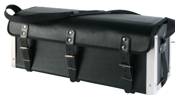
PB136 Sac Plombier cuir

En croûte de cuir Dimensions : 120 x 120 x 350 mm