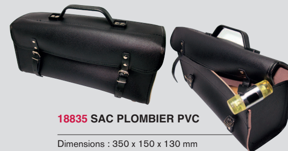
18835 SAC PLOMBIER PVC

Dimensions : 350 x 150 x 130 mm ⚠ Livré sans outils