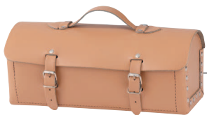
166 Sac Auto cuir

En croûte de cuir Dimensions : 120 x 120 x 350 mm