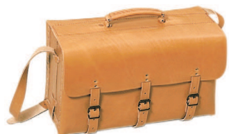
3000 Sac carré cuir

Finition en cuir Angles renforcés en acier Dimensions : 520 x 200 x 180 mm Poids : 1,2 kg