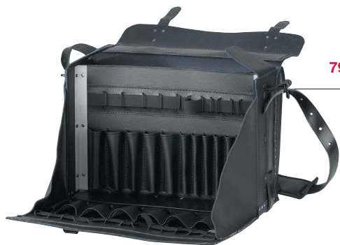
7960 Pilote Case Poches cuir

En cuir vachette pleine fleur 1 Séparation et 1 Porte-outils élastique. Dimensions : 450 x 250 x 200 mm