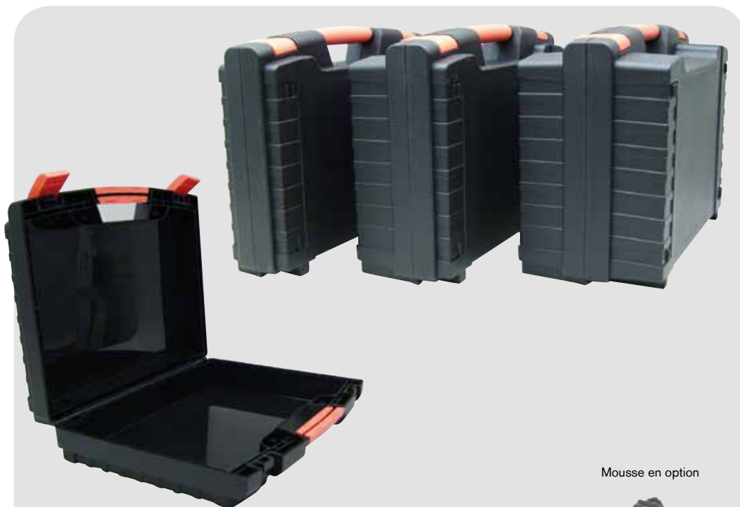
HEAVY (Paroi alvéolées)