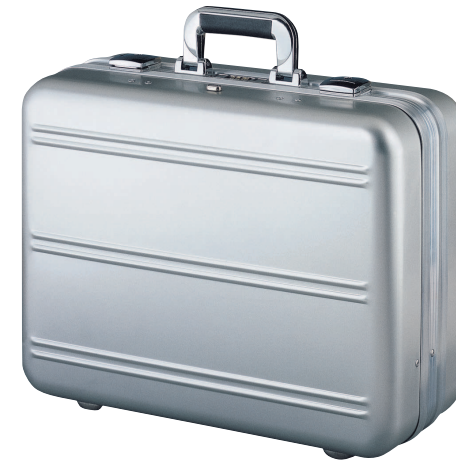
7020 ALUX 7923 ALUX