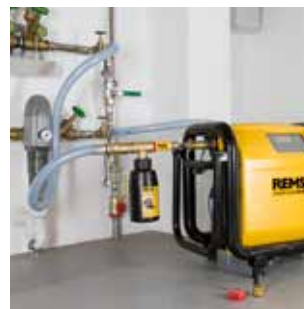
Désinfection d'installations d'eau potable