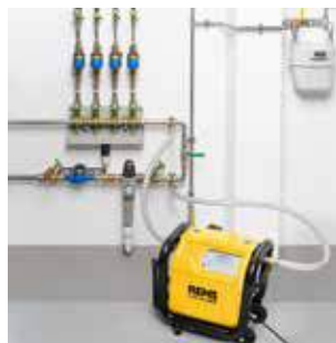
Rinçage d'installations d'eau potable